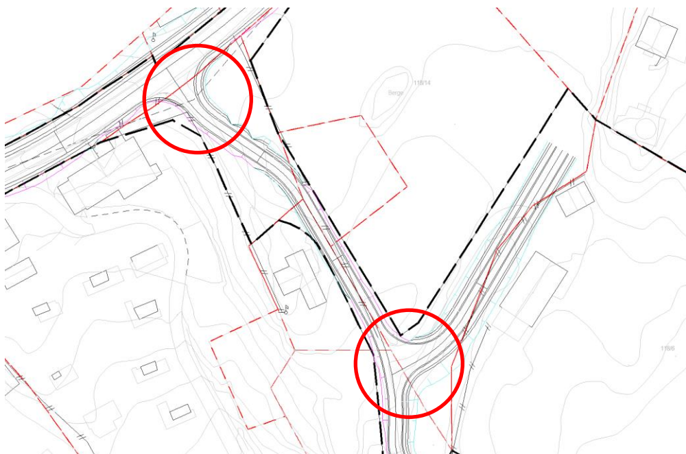
Figur 1: Skisse over tenkt ny vegtrase. Avkøyringar som skal utbetrast er markert med raud ring.

Planområdet er på ca. 13,8 daa og ligg på gnr. 118 bnr. 6 m.fl i Strandebarm i Kvam herad. Føremålet med reguleringsplanen er å leggja til rette for etablering av tre nye tomter for einestadar, samt utbetra eksisterande tilkomstveg jf. Statens Vegvesen si handbok N100 med utbetra avkøyring mot fylkesvegen og inn til eigedomen. Vegtraseen skal endrast til å hamna lenger ut frå eigedom 118/32. Midtlina på vegen vil gå langs med eigedomsgrensa mellom 118/32, 25 og 14.